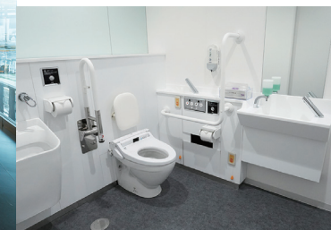
07 バリアフリートイレ