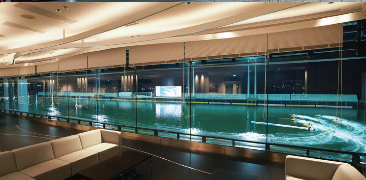
大迫力の第1ターンマークを一望