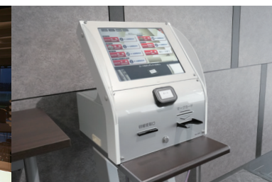
06 キャッシュレス投票機